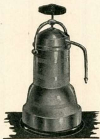
Cafetière Electrique Contenance 4 tasses