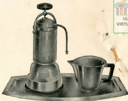
Le service est composé de : 1 Cafetière Electrique, 1 Verseuse, 1 Plateau [Se fait dans les contenances de 4, 6 et 8 tasses 110 ou 220 V. A préciser à la commande