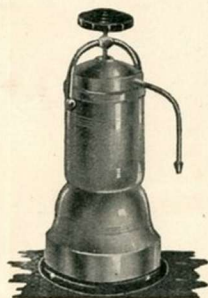
Cafetière Electrique Contenance 6 tasses