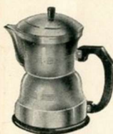
Théière Electrique contenance 1 litre