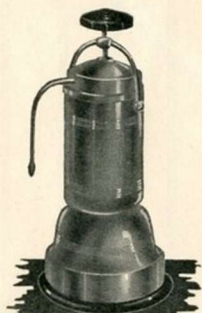
Cafetière Electrique Contenance 8 tasses