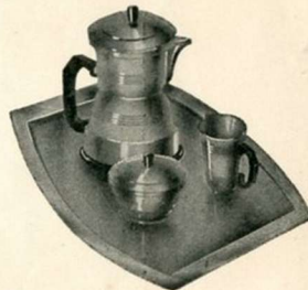
Le service est composé de : 1 Théière Electrique, 1 Pot à lait, 1 Sucrier, 1 Plateau 110 ou 220 V A préciser à la commande